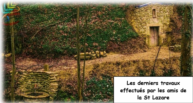
Les derniers travaux effectués par les amis de la St Lazare

Venez, vous aussi, vous y promener. Vous vous y ressourcerez !